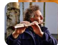
© S. Heydom - K. Hecke - Ch. Heilhake